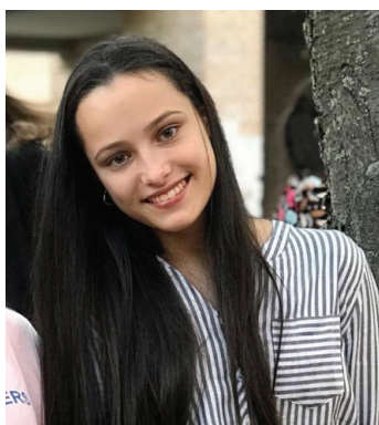
, 8"А" Главный редактор