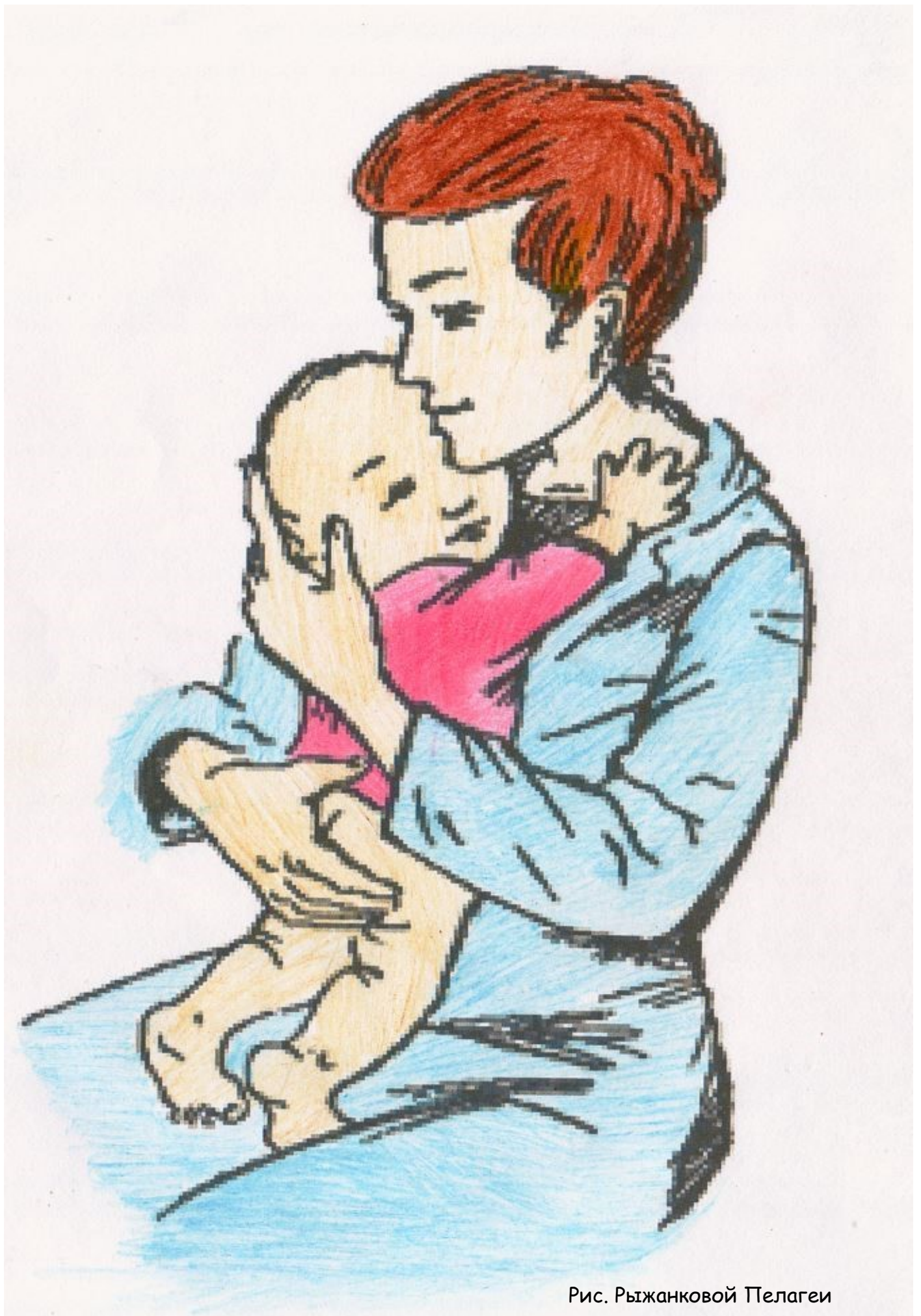
Рис. Рыжанковой Пелагеи